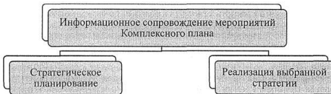
Рис.2. Планирование информационного сопровождения мероприятий Комплексного плана

Необходимость информационного сопровождения обусловлена растущей активностью радикальных группировок в информационном пространстве в целом. При этом антитеррористическая и антиэкстремистская деятельность остается неизвестной и непрозрачной для гражданского общества. Планирование информационного сопровождения предполагает два уровня (см. рис. 2).