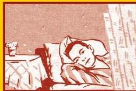
Избегайте контактов с заболевшими