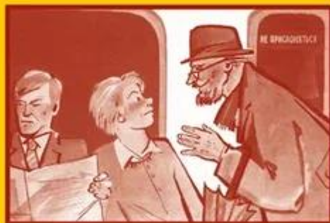
Ограничьте пребывание в местах скопления людей